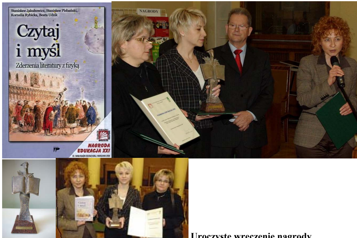
Uroczyste wręczenie nagrody

Książka została uhonorowana NAGRODĄ EDUKACJA XXI podczas 23. Targów Książki Edukacyjnej w Warszawie, 13-16.03.2008 r. za wartości edukacyjno-poznawcze i poziom edytorski.